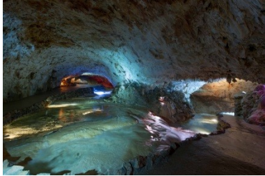
Grotte de Choranche